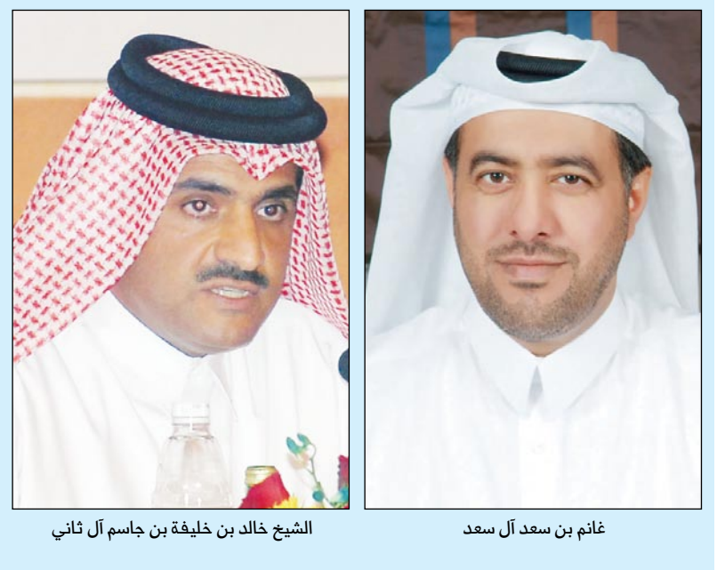
الشيخ خالد بن خليفة بن جاسم آل ثاني

أعلنت شركة بروة العقارية والشركة القطرية للاستثمارات العقارية أمس أنه في أعقاب الإعلان المشترك للشركتين في 10 يناير 2010 للبيود المالية للصفقة المقترحة بين الشركتين "الصفقة المقترحة"، تمت صياغة البنود النهائية للصفقة المقترحة، حيث سيتم تطبيق الصفقة المقترحة من خلال عرض تقديم بروة للاستحواذ على أسهم العقارية مقابل أسهم في بروة. وتعرض بروة الاستحواذ، وفقا للشروط والأحكام التي سيتم توضيحها في مستند العرض، على كل سهم من أسهم العقارية مقابل استبداله بـ 1.100 سهم في بروة. وهذا سيتم مطابقة مساهمي بروة والعقارية بالموافقة على القرارات المرتبطة بالصفقة المقترحة في اجتماعي الجمعية العمومية غير العادية لكل من الشركتين اللذين سيعقدان في 30 مارس 2010. وتعددت شركة الديار القطرية للاستثمار العقاري التي تعتبر